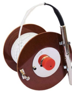
Kabellichtlot bis 50m Länge auf Handtrommel

Das hochgenaue Messkabel ist lieferbar mit cm/mm oder Fuß und 1/100 Fuß Teilung.