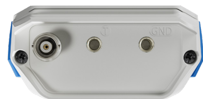
BNC und Temperaturanschluss und 2 x Banane