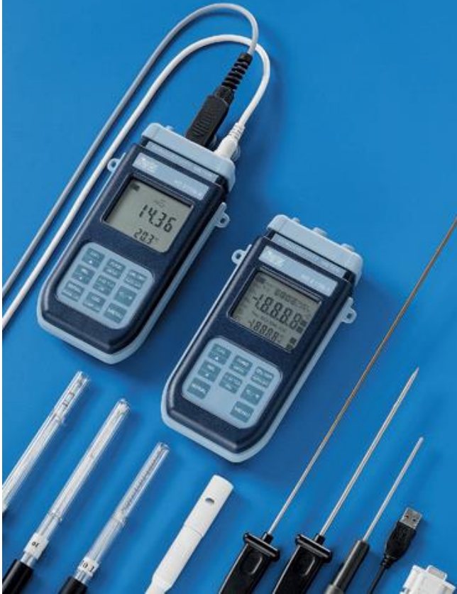
HD 2106.1, HD 2106.2